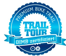
DIMB – Premium Bike Trail

Was die Erholungseinrichtungen betrifft, die im Verlaufe von zertifizierten Wegen erstellt werden (z. B. Ruhebänke, Rastbänke, Rastplätze, Grillplätze, Grillhütten, Spielgeräte für Kinder, Aussichtsplattformen, Schutzunterstände und Schutzhütten), gilt Folgendes: