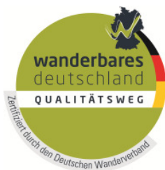
Qualitätsweg Deutscher Wanderverband