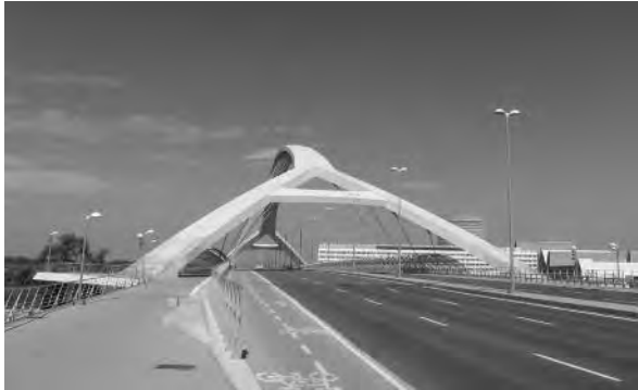
Cliché S. Clartmont, 2010.

occasion, assurent la jonction avec les principaux axes de dessertes de la ville (autoroute AP 68, gare intermodale de Delicias). Les avenues Alzamora, Echegaray et Ranillas, qui longent l'Èbre, ont également fait l'objet d'importants réaménagements afin d'assurer la continuité de cette liaison entre le Parc métropolitain de l'eau et le centre-ville historique. Comme à Lyon ou à Bordeaux, l'aménagement des berges correspond à la volonté de (re)mettre l'eau à l'honneur dans la ville tout en renforçant les liaisons et les déplacements doux au cœur de la ville. Aménagés dans une logique de trame verte parallèle au fleuve, les quais ont été conçus comme des lieux conviviaux prêts à accueillir des gens nomades, en transit (pistes cyclables,